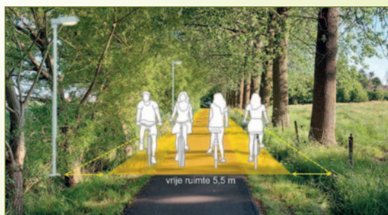
Een simulatie van hoe de fietssnelweg er zou kunnen uitzien.