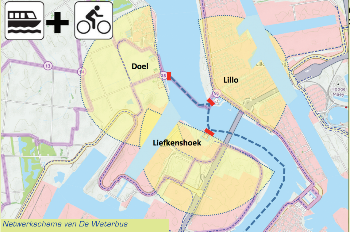
Netwerkschema van De Waterbus