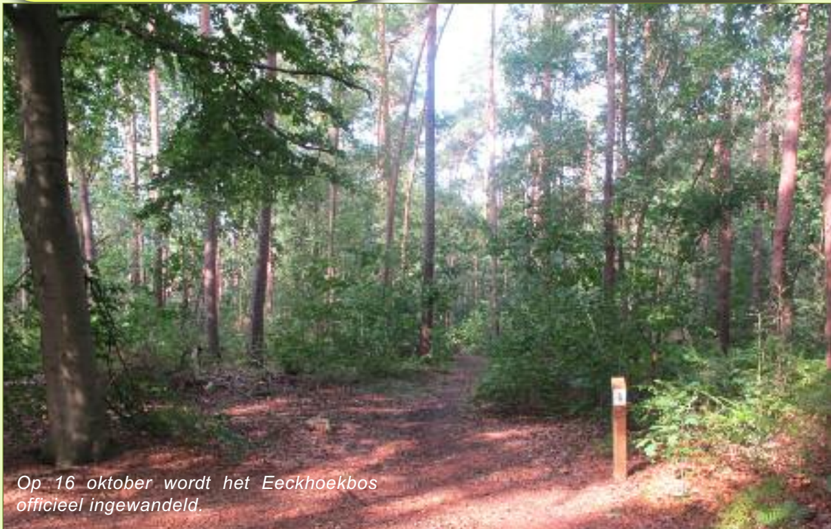
Op 16 oktober wordt het Eeckhoekbos officieel ingewandeld.

In het Eeckhoekbos is ook plaats voor jeugdbewegingen en schoolgroepen