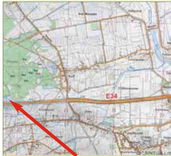
studievijver (topografische kaart Sint-Gillis Waas - Beveren 1/25000)

De Belgische Biotische Index evalueert de kwaliteit van een waterloop. Deze index is gebaseerd op de aan- of afwezigheid van met het blote oog zichtbare ongewervelde waterdierpjes, de zogenaamde macro-invertebraten. De BBI integreert twee factoren: de aan- of afwezigheid van verontreiniginggevoelige soorten en het totale aantal aangetroffen soortengroepen. De Belgische Biotische Index is dus een indicator van ongewervelden die varieert van 0 (geen indicatoren aanwezig) over 1 (enkel soorten van verontreinigd water) tot 10 (soortenrijke gemeenschap met kwets-