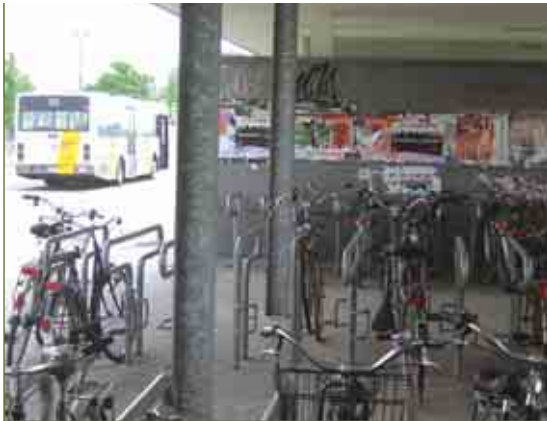
De onherbergzame overstaphalte Melsele-Krijtsbaan

goed voor nog eens 182.038 buskm op jaarbasis. Samengevoegd betekent dit voor het hele traject 478.500 buskm minder. Of 957.000€ minder op jaarbasis.