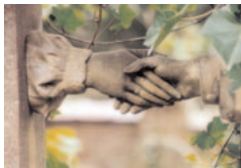
foto's :Het kerkhof van Ukkel: natuur en cultuur hand in hand