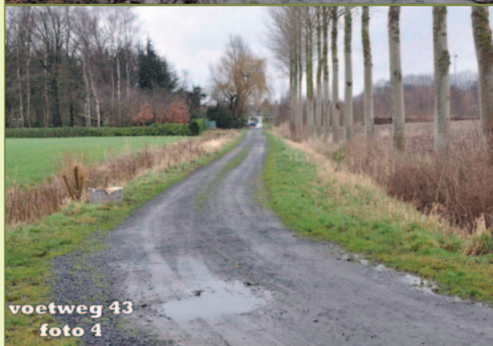
bestaande veelgebruikte voetweg nr 43

bereikbaarheid van de campus van de nieuwe LAB-school.