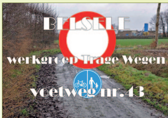
Pijkedreefweg (nr 43) : enkel voor fietsers en voetgangers

Zeker met het oog op de toekomstige ontwikkelingen in de onmiddellijke omgeving en de verdere groei van de LAB-school, nieuw zwembad, realisatie Sportkringspark is een 'dubbele'