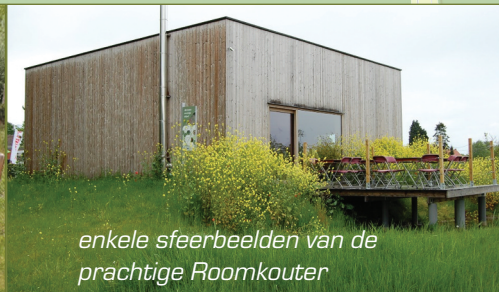
enkele sfeerbeelden van de prachtige Roomkouter