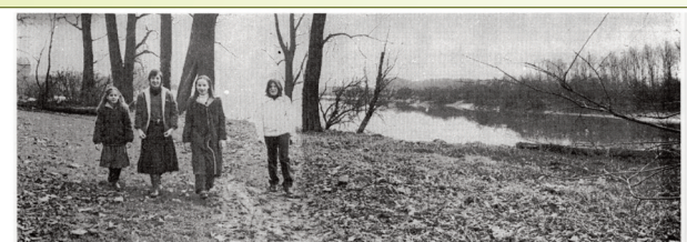
Voetweg 25 ligt heerlijk langs een van de meest pittoreske plekken van het Durmegebied. Tielrode vertoef hier bij veldsporen van deert voorting en het doet er naar uit dat de post-ropenrichting al gelijk was die kant uit krijgen.