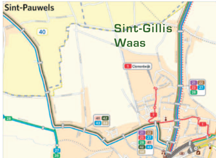
Figuur 2: Op dit netplan van DE LIJN merkt men duidelijk hoe bediening van de Clementwijk met openbaar vervoer een bijkomende buslijn vergt tussen de bestaande lijnen op de invalswegen (lijnengroep 40-44 naar Sint-Pauwels-Stekene en de lijnengroep 21-28 naar Sint-Gillis Waas)

versnippering van buslijnen. De busfrequentie in de Clementwijk is dan ook veel te laag om echt een alternatief te bieden voor de auto. Gelukkig is er nog het echte alternatief: de fiets. Dankzij de Stropersfietsroute is de Clementwijk goed verbonden met het stadscentrum. Alleen is natuurlijk wel een optimale beveiliging nodig, met voorrang voor de fietsers bij het kruisen van de Kuildamstraat en de Heistraat. Voor de verkeersknoop aan de Driekoningenstraat werkt ABLLO vzw aan een voorstel om de plannen die thans worden gemaakt, nog fietsvriendelijker te realiseren.