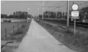
Fietsroute naar Nieuwkerken. In de nabije toekomst doorgetrokken naar Beveren en verder en ook naar Kruibeke ?

De stad Sint-Niklaas heeft het plan opgevat om verschillende fietsroutes vanuit gemeenten buiten Sint-Niklaas te ontwikkelen naar Sint-Niklaas centrum toe. Sommige routes bestaan reeds gedeeltelijk, andere moeten nog uitgebouwd worden. Ook Stekene en Temse willen fietsverbindingen met hun randgemeenten. De figuur hiernaast schets de situatie voor Sint-Niklaas. Dit zijn lovenswaardige plannen!