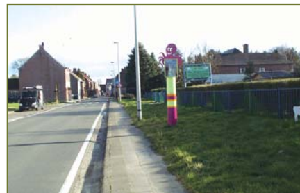
de fietsweg verder door te trekken tot de zone 30 van de scholen.

Wat men nu aanlegt, ligt er voor meer dan 30 (40, 50??) jaar ! Dus nu toekomstgericht aanleggen is de boodschap! Fietsen als ecologische schakel in mobiliteit wordt steeds belangrijker (opwarming aarde!!). Brede goede infrastructuur voorzien is dan ook een uitdaging.