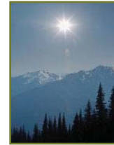
Fig 5: Luchtvervuiling kan als een mist de zon ver sluieren.

een vreemde ontdekking: Atsumu Ohmura onderzocht het verband tussen klimaat en zonnestraling. Hij stelde vast dat de hoeveelheid zonlicht, gemeten aan het aardoppervlak, met