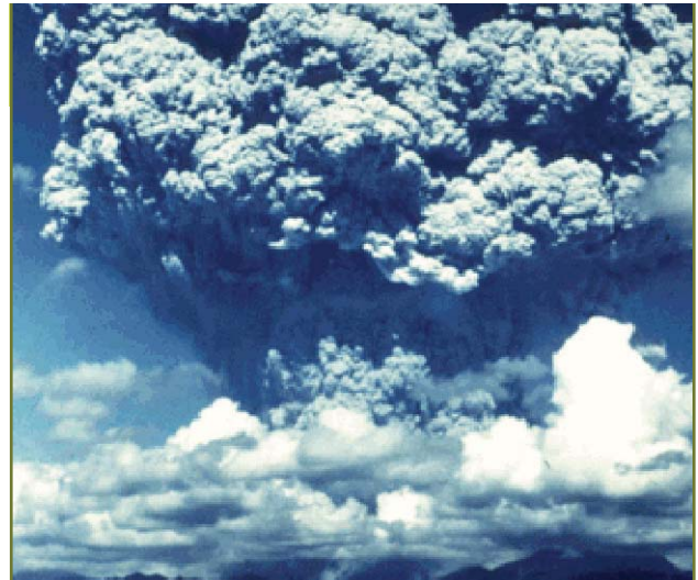
Fig 1: Uitstoot van de vulkaan Pinatubo op de Filippijnen (juni 1991)

Wetenschappers noemen dat fijn stof aerosolen. Naast dit directe effect te wijten aan de aanwezigheid van aerosolen in de atmosfeer, bestaat er ook een indirect effect. Wanneer deze kleine stofdeeltjes of aerosolen in de wol-