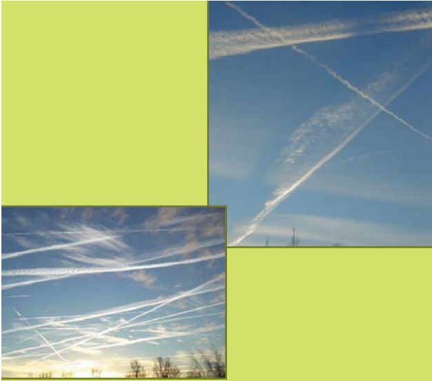
Fig 4: Netwerk van condensatiestrepen

vlak. Er is sprake van toenemende zonnebelemmering.