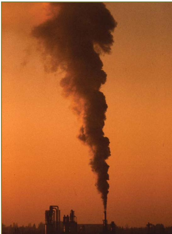
Fig 3: Uitdijende rookpluimen kunnen ook de zonnestraling tegenhouden

op vooral zoutkristallen en stuifmeelkorrels, die in de atmosfeer rondzweven.