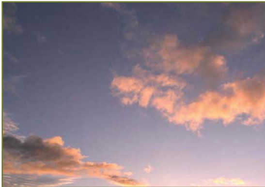
Fig 2: Natuurlijke wolken

Wat moeten we ons nu voorstellen bij het verschijnsel 'global dimming'? En wat is de relatie met het bekendere fenomeen van de 'global warming'?