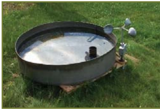
Fig. 6: Meetopstelling voor panverdamping

oppervlak warmer wordt, waardoor meer verdamping zou optreden van moerasgebieden en open water ecosystemen. Maar schijn bedriegt.