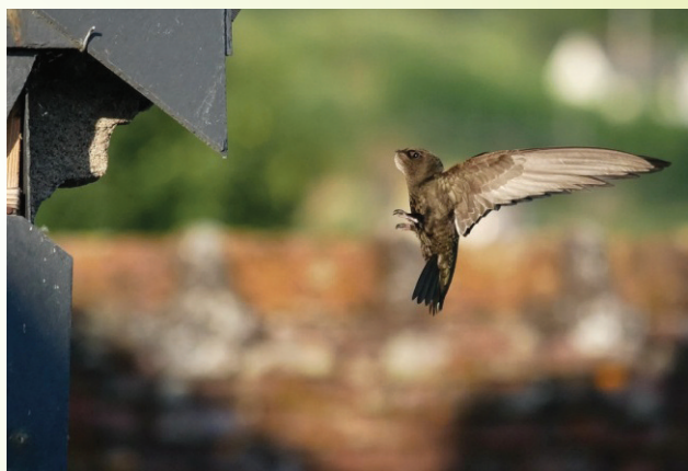
Bij een nest aan een hoek van een dak aanvliegende gierzwaluw. Voeten (tenen) klaar om aan de rand van de nestholte over te nemen van de gevouwen vleugels. In de keelholte zit een bol insecten, los samengeperst met speeksel. Veel van deze insecten leven nog.

Gierzwaluwen zijn voor hun voortplanting gebonden