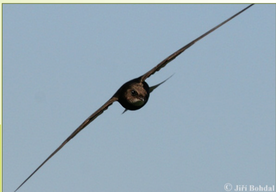
Vooraanzicht vliegende gierzwaluw

Gierzwaluwen brengen het grootste deel van hun leven door in de lucht. Zelfs slapen en paren doen ze al vliegend. Alleen voor het broeden komen ze 'aan land'. Met hun relatief kleine snavel die ver kan geopend worden, vangen ze in volle vlucht duizenden insecten.