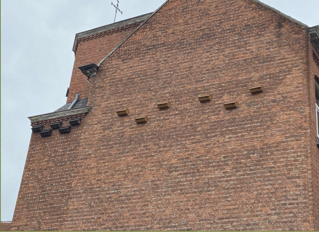
Nesten door de brandweer geplaatst bij de Berkenboomschool in Sint- Nikolaas