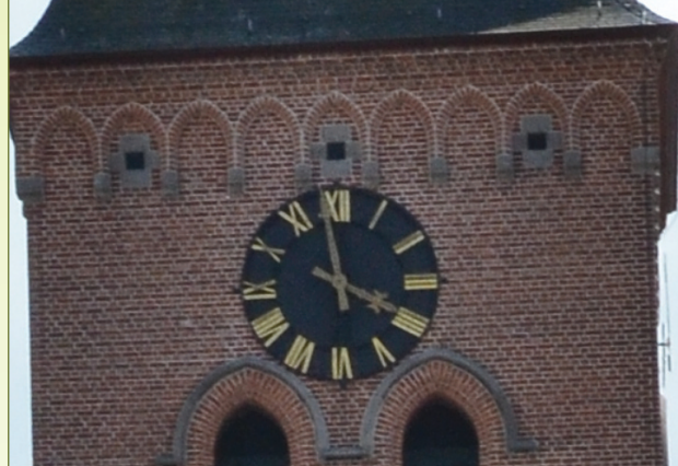
Stellinggaten Sint-Petruskerk Tielrode

Tijdens een MiNa-Raad Temse stelden we voor om de stellinggaten van de Sint-Petruskerk Tielrode te verkleinen. De MiNa-Raad Temse stuurde de vraag naar de kerkfabriek. We hopen op een goed gevolg. Ook jij kan je steentje bijdragen. Enkele mogelijkheden: