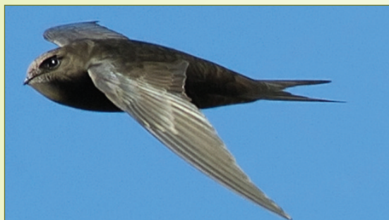
Zijaanzicht vliegende gierzwaluw

Vaak zien we ze in het voorjaar en hoogzomer hoog boven Tielrode met enorme snelheid door de lucht glijden, terwijl onophoudelijk hun gierende roep weerklinkt. Gierzwaluwen, met hun zeer lange sikkelvormige vleugels, relatief korte en gevorkte staart, zoals donkere vliegende ankertjes.