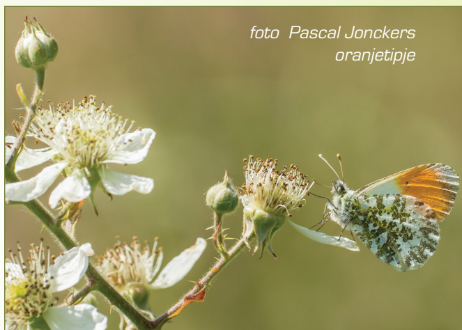
oranjetipje

Tenslotte werden in de Durmevallei in Zele (in het reservaat de Durmemeersen) twee dossiers afgehandeld goed voor 1 hectare grasland. Die percelen zullen zich onder ons natuurbeheer kunnen ontwikkelen tot soortenrijke graslanden ( zie foto ) met dotterbloem, pinksterbloem en echte koekeksbloem. Vooral het oranjetipje ( zie foto ) en de roodborstapuit zullen hier meteen van kunnen profiteren.