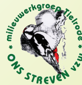
Milieuwerkgroep Ons Streven vzw