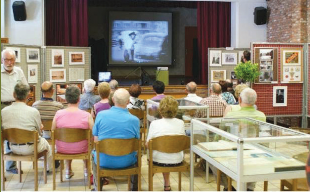
Een zeer geïnteresseerd publiek bekijkt de film over Tielrode in de jaren vijftig.

Burgerinitiatief Roomacker is een afdeling van Milieuwerkgroep Ons Streven vzw