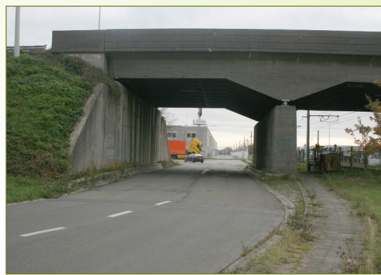
onderdoorgang onder de N70