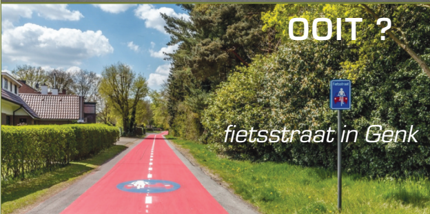
fietsstraat in Genk