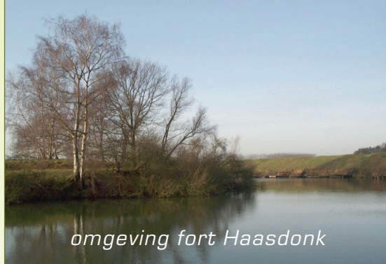
omgeving fort Haasdonk

dan links 1200m stappen op een wandelpad (een vroegere spoorweg). Ondertussen de Kruisstraat 'kruisen'! Als je niet meer verder kunt [11] naar links een boswegel 900m blijven volgen. Je komt in de wijk 'Dennenlaan' [12] .