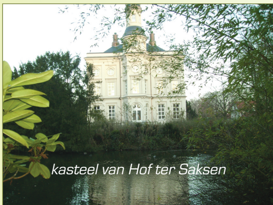
kasteel van Hof ter Saksen

Nu 200 meter naar links tot de Oude Baan [9] . Deze smallere asfaltweg 800 meter volgen [10] ,