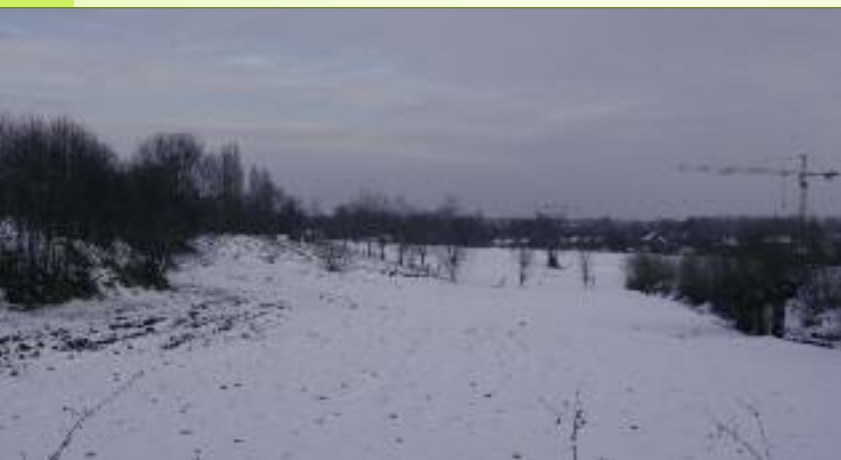
Foto 6: In de Molenstraat word je verrast door het glooiend landschap, dat met een beetje fantasie doet denken aan de Vlaamse Ardennen

De uitzonderlijke natuurwaarde dankt dit gebied aan haar unieke zoetwaterslikken en -schorren. Na de doorbraak van de Schelde naar zee via de Westerschelde in de 12de eeuw, kennen we hier een getijdenwerking met dagelijks tweemaal hoog- en tweemaal laagwater met een tij-amplitude van 5 meter (bij springtij 6 meter en meer). Het Tielrodebroek kadert in het Sigmaplan, opgesteld na de overstromingsramp van 1976