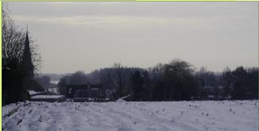
Foto 5: Vanuit de Roomackerwegel krijg je zicht op de samenvloeiing van de Durme in de Schelde, samen met de 'torens' van Tielrode

We kruisen de Kerkstraat en duiken de volgende wegel [voetweg 24 Roomakkerwegel] in. Bij de splitsing gaan we naar links [voetweg 29 Kouterwegeltje] en komen zo in de Molenstraat.