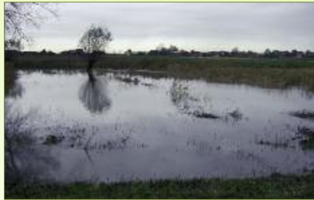
Kieldrechtse Watergang ten westen van Polderstraat, Perceeltje gemaaid in oktober door Natuurpunt

Ook in Sint-Gillis-Waas vingen de Kluzegavers en de percelen langs de Kieldrechtse Watergang en de kreken van Kieldrecht en Meerdonk veel water op dat anders in woongebieden, bedrijventerreinen of op akkers terecht kwam.