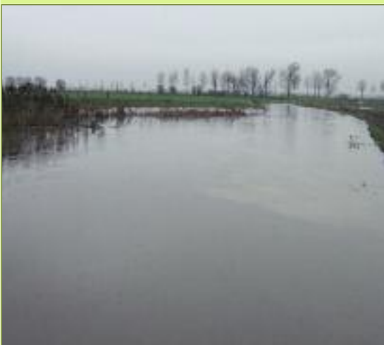
Waterstraat, zicht vanop brug naar het Oosten