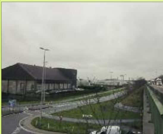
Foto1: De bestaande Ambachtelijke zone Kluizenmolen in Sint-Gillis Waas ligt aan de zuidkant van de E34 en wordt thans beperkt uitgebreid richting Stekene.

Jammer genoeg werd met onze bezwaren maar half rekening gehouden. Gelukkig is Stekene in december 2010 niet erkend als BEK, maar Sint-Gillis Waas spijtig genoeg wel. De grote vrees is nu dat tijdens de komende jaren het open land-