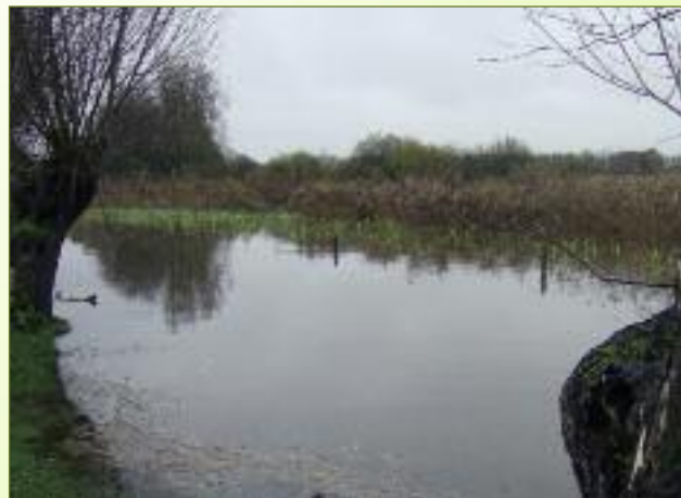
Rietmoer, oever aan noordkant Saleghemkreek, weide en hooiland gemaaid in oktober