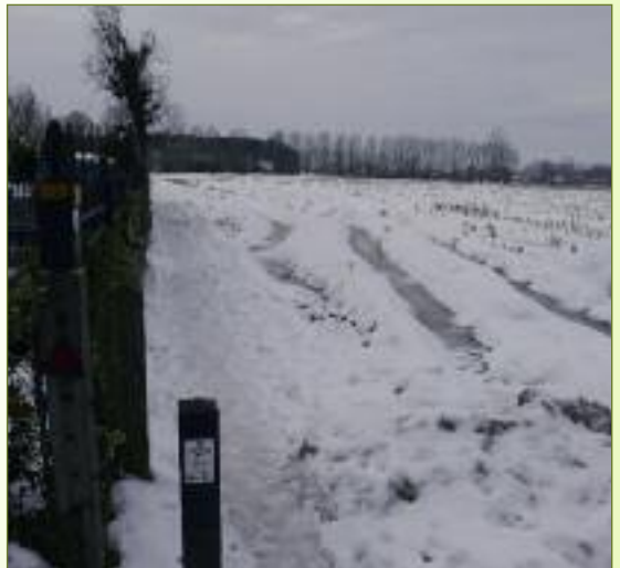
Foto 2: Het voetwegennetwerk is in Tielrode bijna volledig intact gebleven mede dankzij Ons Streven

Voetwegen zijn pittoreske doortochtjes, slingerend door ons landschap, die spontaan gegroeid zijn om afstanden in te korten. In Tielrode is dit historisch ontstane voetwegennet bijna volledig intact gebleven. Het is sinds de wet van Leopold I van 10 april 1841 toen de Atlas van de Buurtwegen werd opgesteld, dat deze trage wegen ook een wettelijk karakter gekregen hebben. Men sprak toen van marktwegeles, kerkwegeles, pestwegeles, molenwegeles en galgwegeles.