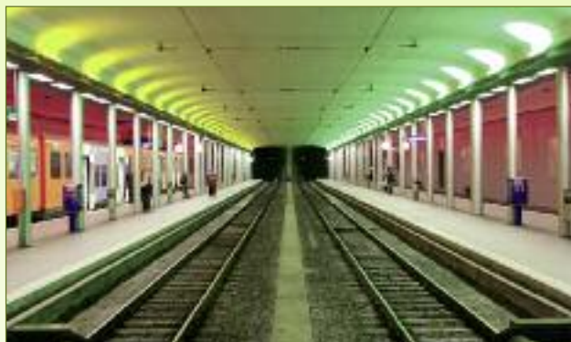
Het compacte RBS-station te Bern met een moderne buurtspoorweg.