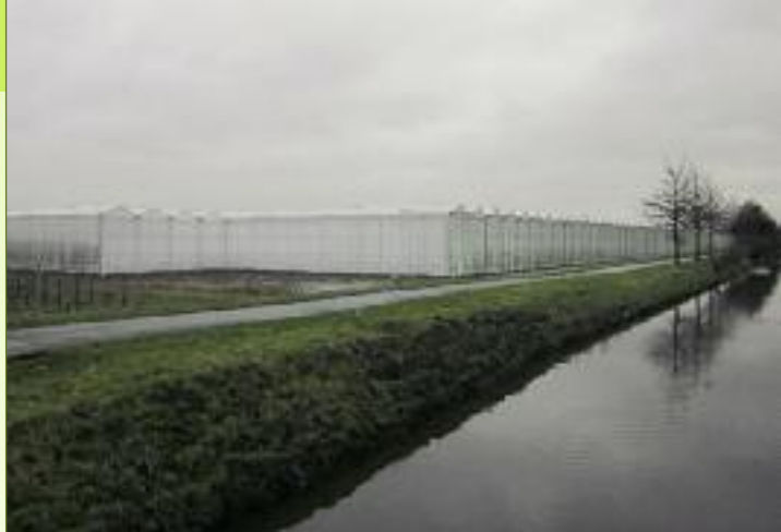
Foto 4: Helaas wordt deze open ruimte ook door de tuinbouw zelf bedreigd. In de loop van de zomer 2010 verscheen in dit open landschap ten zuiden van de E 34 nabij de meubelwinkel 'De piramiden' dit reusachtig serre complex, tegen vele negatieve adviezen in én tegen het provinciaal zoekplan voor de glastuinbouw.

De stad Sint-Niklaas leverde reeds een aantal inspanningen om de lichthinder van de openbare verlichting te beperken. Zo werd ondermeer de verlichting van de Grote Markt, van het Stationsplein, het Westerplein en van het centrum van Belsele reeds sfeervol aangepast. De stad viel daarvoor eerder al in de prijzen. Onder meer won de stad Sint-Niklaas de eerste prijs van de international Dark-Sky association in 2005. Aan de inspanningen werd in het Groene Waasland eerder aandacht besteed. Helaas worden op het Stationsplein sedert enige