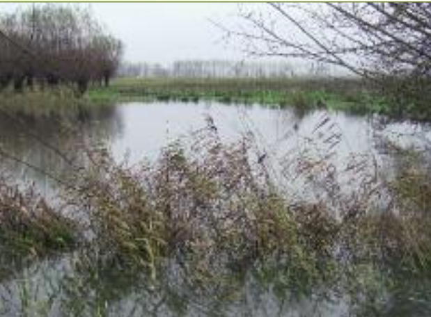
Konijnenpijpen, wiertjes volgelopen