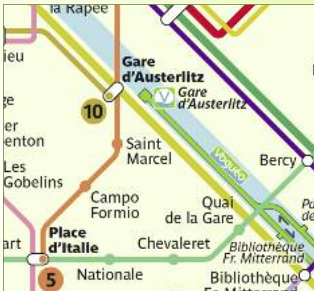
Metrolijn 5 in Paris-Austerlitz, 40.000 in en uitstappers per dag, twee korte perrons

Antwerpen-C., kelderverdieping: met treinen die niet vlot bergop kunnen rijden, doordrustige hoeken op soms veel te lange perrons en vooralsnog veel te weinig klanten.