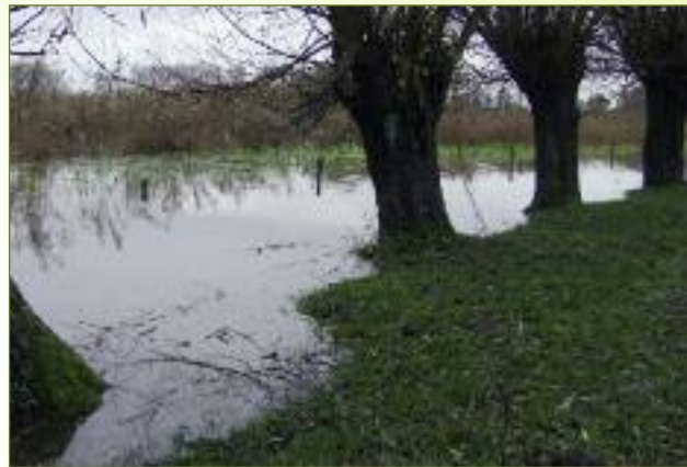
d'Eilanden, westkant, oever aan Saleghemkreek, weide en rietland gemaaid in augustus tijdens oude ambachten dag