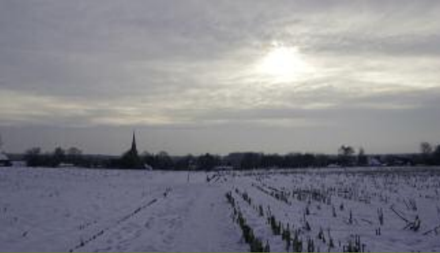
Foto 4: 30 meter boven de zeespiegel, vanaf de Wase Cuesta in Tielrode heb je een mooi valleizicht en met helder weer kan je zelfs het Atomium van Brussel bewonderen

Foto 5: Vanuit de Roomackerwegel krijg je zicht op de samenvloeiing van de Durme in de Schelde, samen met de 'torens' van Tielrode