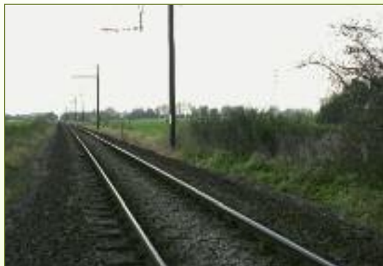
9 fietspad doorheen landbouwgebied