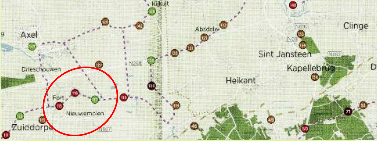
De hier beschreven Fortenroute (op deze kaart de verbinding tussen nrs 115-116-117) maakt deel uit van de Staats-Spaanse Linies nabij het centrum van de gemeente Axel.