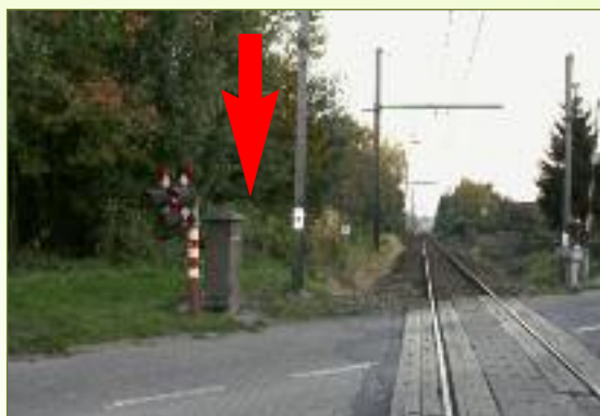
6 hier lukt het wel