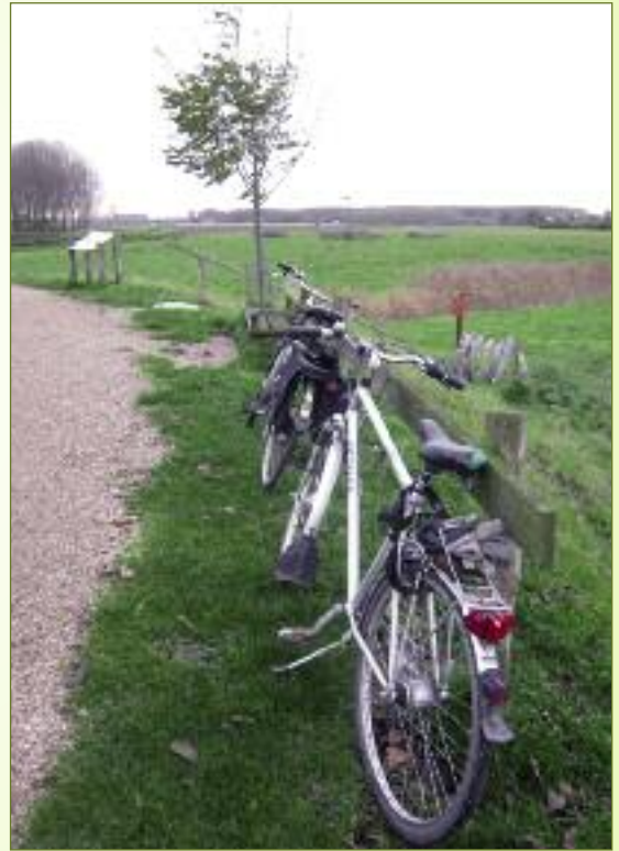
Foto's op deze pagina: Nabij de bezienswaardigheden werd eenvoudige infrastructuur aangebracht: een fietsstelplaats, een picknicktafel en zelfs een paalkampeerterein.