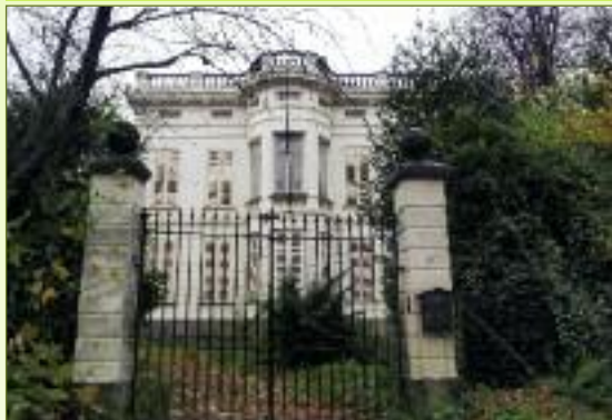
park van Bunneghem in de Kasteeldreef in Temse moet wijken voor woningen,

Oude bomen zijn waardevolle biotopen en monumenten, maar worden in Temse jammer genoeg stilaan een zeldzaamheid.