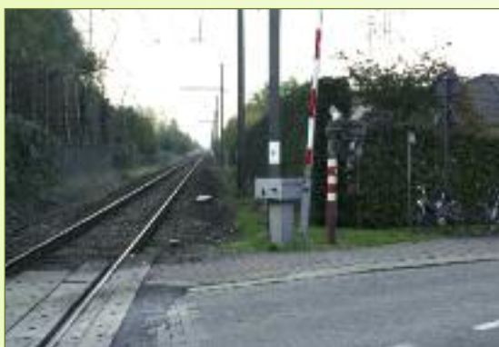
5 Moeilijke keuze!