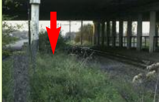
3 Kruising met E17