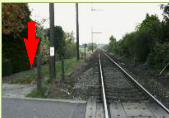
8 gemengd gebruik zoals in Beveren. zie p5