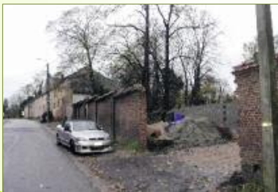
het kasteelpark in de Kerkstraat in Tielrode moet wijken voor woningen,