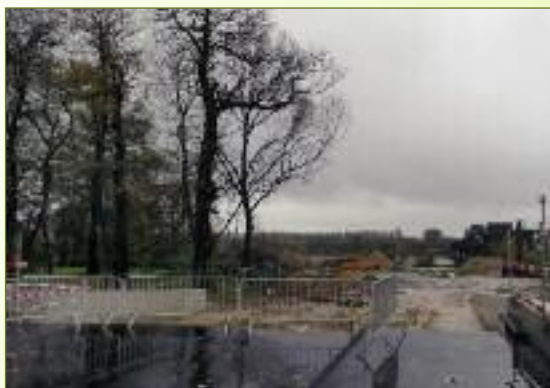
Scheldepark in de Kasteelstraat in Temse → ontsluiting kaabedrijf Belgomine.