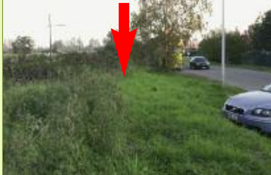
2 Veel plaats in de Laarstraat.