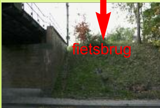
10 het gewest betaalt een fietsbrug