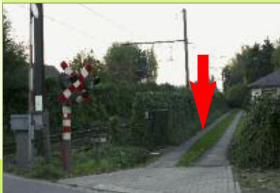
7 gemengd gebruik zoals in Beveren. zie p5