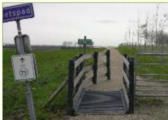
De Fortenroute werd opgenomen in het fietsroute netwerk van Zeeuwsch-Vlaanderen. De bewegwijzering verwijst naar de fietsknooppunten kaart.