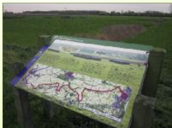
Op een aantal interessante plaatsen werd een eenvoudig informatiebord geplaatst. Daarop vindt de bezoeker wat historische achtergrondinformatie en ook een aantal weetjes over de historische sporen in het landschap.