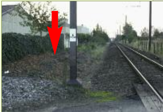
4 gemengd gebruik zoals in Beveren. zie p5 Brandweg voor bedrijf en fietspad.