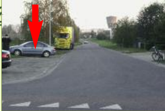
1 Veel plaats in de Laarstraat.