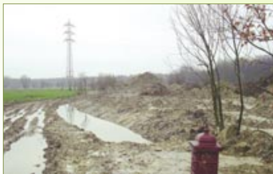
De "herstelde" poel ligt nu niet meer op haar oorspronkelijke plaats.

Doordat deze poelgracht niet meer kan afwateren via de oorspronkelijke buis, heeft men nu wateroverlast op de aangrenzende de akker richting E17. Op de foto's zien we een ophoging die soms meer dan 1 meter bedraagt.