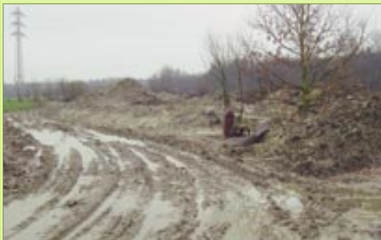
De Bergdreef en gevulde poelgracht

gewest] werden de werkzaamheden uiteindelijk stilgelegd. Net voor de stillegging was de gedumpte poelgracht, op bevel van het stadsbestuur, terug opengelegd. Een terechte beslissing en tegelijk weer niet goed vond de Raaklijn want de "herstelde" poel ligt nu niet meer op haar oorspronkelijke plaats.