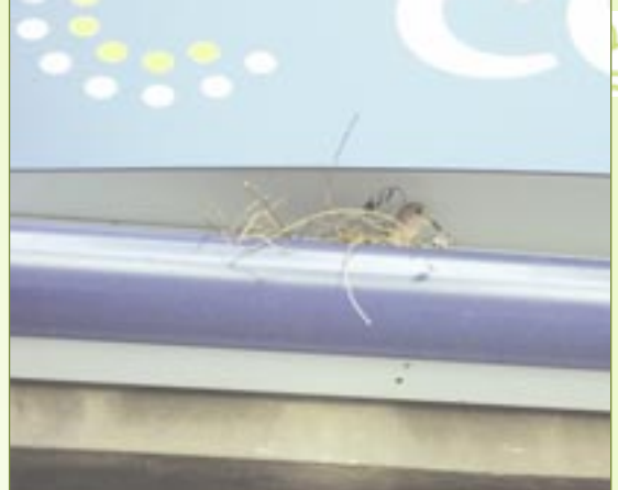
Aan 't groene wasland, Hierbij een foto van een broedende Turkse tortel in mijn lichtreclame. Met vriendelijke groeten,