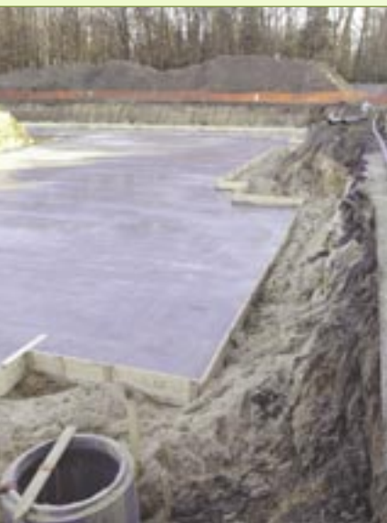
bouwput in de Kleemstraat

Tijdens het krusverlof werd de bouwput (vroeger site Van Remoortel) in de Kleemstraat te Belsele uitgegraven.