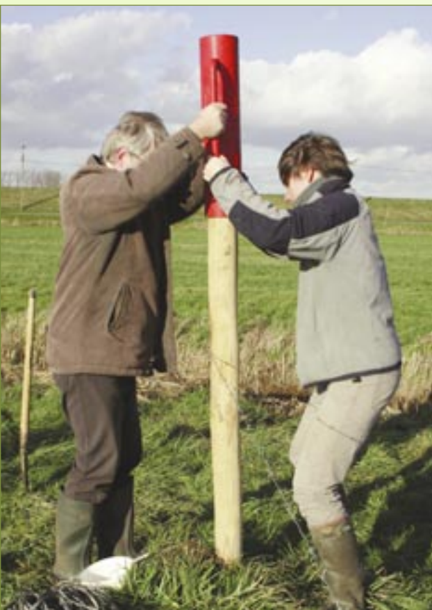
Weidepalen planten... kinderspel!

Het reservaatproject Scheldebroecken op het grondgebied van Zele, Belare en Wichelen herbergt al jaren een mooie populatie aan roodborsttapuiten. Zo'n vijftal koppeltjes komen, verspreid over de perimeter, jaarlijks tot broeden. De kernzone is het Aubroek en het hoger gelegen akkerland t.h.v. het Letterhoutstraatje. Deze schildwacht van de meersen en weiden - de mannetjes zitten vaak te pronken op weidepaaltjes en prikkeldraden - is niet de kieskeurigste onder de vogels. Hij is vooral gebaat met enkele struikachtige elementen in een open landschap, en een beetje variatie in het reliëf, bijvoorbeeld de dijken langsheen de Schelde.