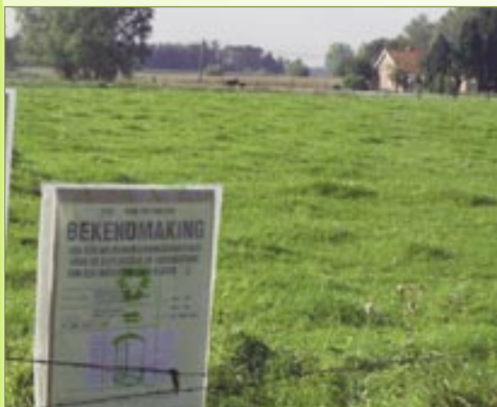
Ook langs de landelijke Hoogstraat krijgen fietsers en wandelaars nu een akelig zicht.