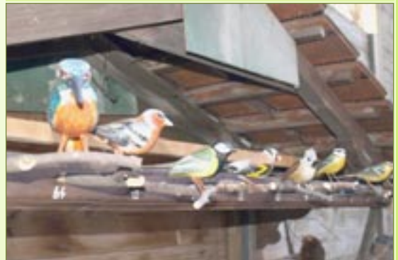
Aan het talrijk publiek vertelde Marcel over het tot stand komen van zijn verzameling houten vogels.