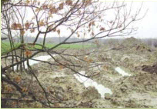
Zicht op opgehoogde akker

Intussen zit alles in de impasse en zal heel deze affaire uitgevochten worden via de rechtbank. Hoe dit gaat aflopen weten we nog niet. Dit zoveelste milieudelict kon men best voorkomen moest men de wet juister geïnterpreteerd hebben.