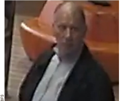
■ De twee verdachten (foto boven en onder)

Samen met de oproep verspreidde de Nederlandse politie ook de camerabeelden van de daders. Dat zoiets pas in februari gebeurt, twee maanden na de dief-